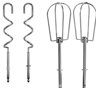
крюк для замешивания теста венчик

кнопка сброса кнопка для переключения в «турбо» режим контроль скорости (1- 5)